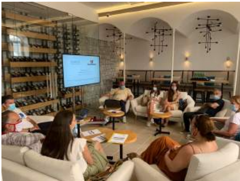
Grupne sesije – razgovor sa psihologom

Broj učesnika na grupnim susretima je bio značajno veći u odnosu na broj korisnika individualnih susreta, što je svakako značajan podatak. Jedna od interpretacija ovakve raspodjele se može ogledati, prije svega u činjenici da novinari nijesu imali ranije u iskustvu mogućnost korišćenja psihološke podrške kroz jedan ovakav organizovani servis. Nadalje, razlog tome može biti i nedovoljna informisanost o psihološkoj djelatnosti i tome šta sve ona može da pruži.