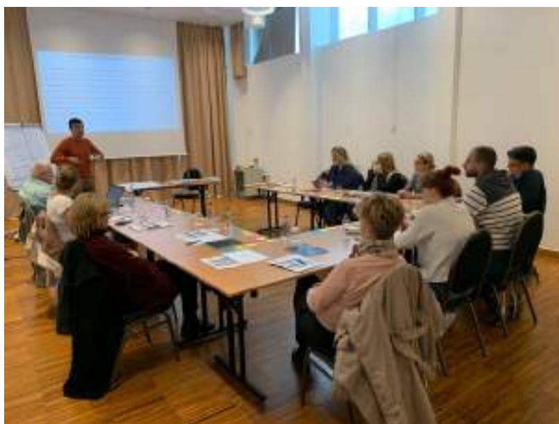
Razgovor novinara/reportera sa psihologom, jedna od grupnih sesija koja je održana tokom 2020. godine

Iz razgovora sa novinarima zaključujemo da dobra praksa psihološke podrške na poslu ne postoji, odnosno da novinari/reporteri u svojim redakcijama nemaju osobu sa kojom bi podijelili probleme koji mogu ozbiljno uticati na radno okruženje i kvalitet medijskog izvještavanja.